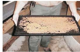
चित्र ४. संक्रमित ट्राउटको लागी औषधी र खाने तेल मिसाएर बनाईएको दाना