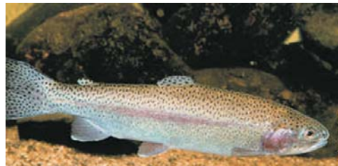
चित्र ५. उपचार पछि स्वस्थ माछा