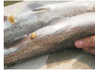
चित्र ३. संक्रमित ट्राउटको मलद्वारमा पहेलो दिशा