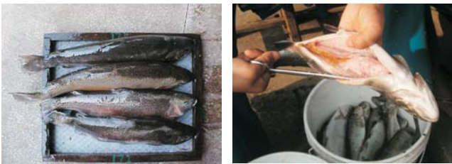
चित्र २.: संक्रमित कालो रंगको ट्राउट र पहेँलो आंदा